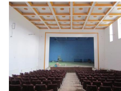
Căminul Cultural "C.I. Popian" este aproape gata.